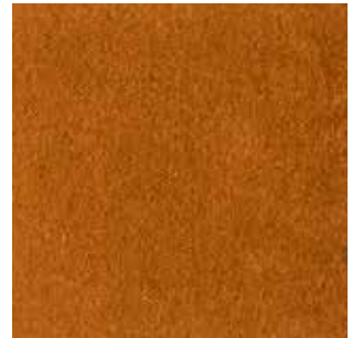
cat. C/2 Econabuk col. 37