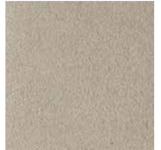
cat. C/2 Econabuk col. 5