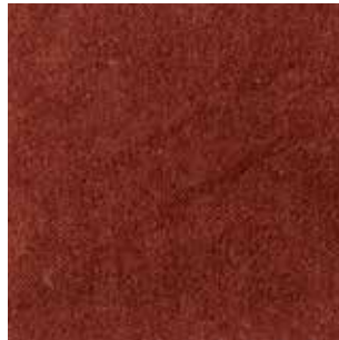
cat. C/2 Econabuk col. 18