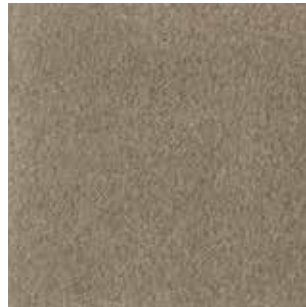
cat. C/2 Econabuk col. 15