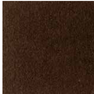
cat. C/2 Econabuk col. 28