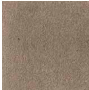
cat. C/2 Econabuk col. 35