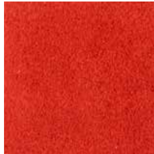
cat. C/2 Econabuk col. 29