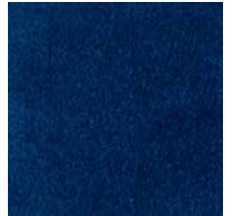
cat. C/2 Econabuk col. 57