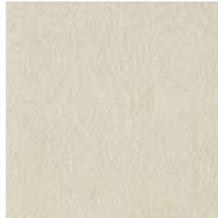
cat. C/2 Econabuk col. 45