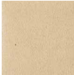
cat. C/2 Econabuk col. 11