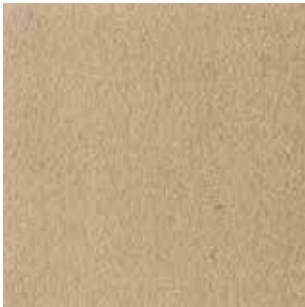
cat. C/2 Econabuk col. 66