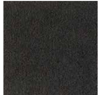
cat. C/2 Econabuk col. 44