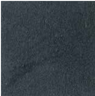
cat. C/2 Econabuk col. 47