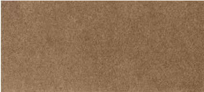
cat. C/2 Econabuk col. 12