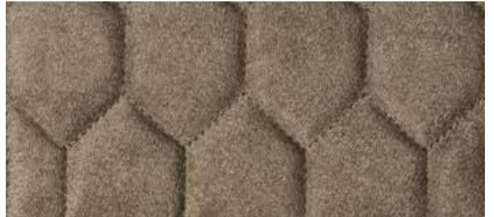
cat. Deluxe Econabuk a esagono col. 15