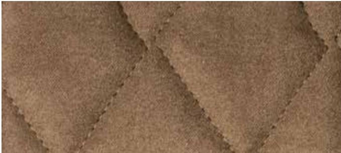
cat. Deluxe Econabuk a rombo col. 12