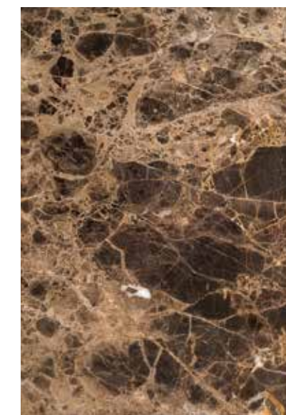
Marmo Emperador / Marble Emperador