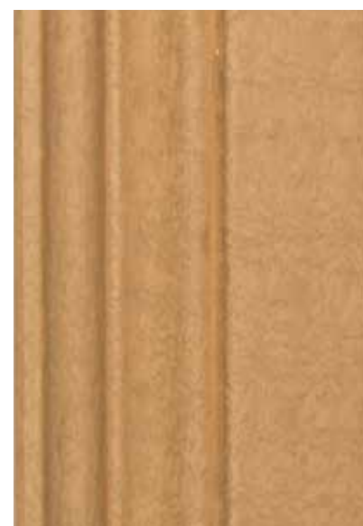
Laccati anticati/veneziani col. Natura Antique lacquered finishing venetian finishing col. Natura