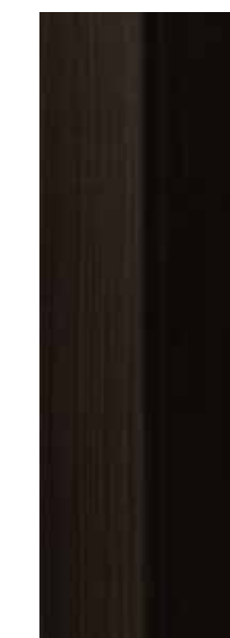
Ferro nero verniciato a polveri epossidiche Black iron painted with epoxy powder

I colori e le venature dei materiali illustrati sono puramente indicativi. Le differenze di colore, le venature più o meno marcate sono la prova che ci troviamo in presenza di materiali assolutamente naturali. Il marmo è una pietra naturale e quindi piccole imperfezioni come taroli, fessurazioni rinsaldatesi, variazioni di tonalità sulla stessa lastra, microporosità, inserti di quarzo o pirite, ecc. non danno adito a contestazioni, ma anzi, sono la garanzia dell'unicità del vostro lavorato finale. The colors and the grain of the illustrated materials are purely indicative. The color differences, the more or less marked veins, are proof that we are in the presence of absolutely natural materials. Marble is a natural stone and therefore small blemishes such as taroli, cracked cracks, shade variations on the same slab, microporousness, quartz or pyrite inserts, etc. do not give rise to controversy, but rather guarantee the uniqueness of the your finished work.