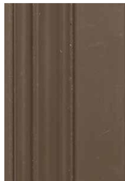
Laccati RAL NCS.S.7005-Y50R Varnished and ral NCS.S.7005-Y50R