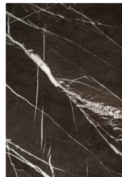
Marmo Piergrace / Marble Piergrace