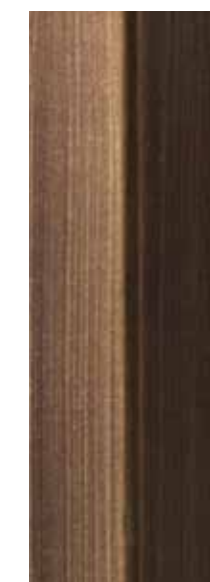
Ferro verniciato a liquido col. bronzo Iron painted with liquid col. bronze