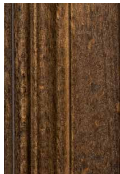
Laccati anticati/veneziani col. Tabacco Antique lacquered finishing venetian finishing col. Tabacco