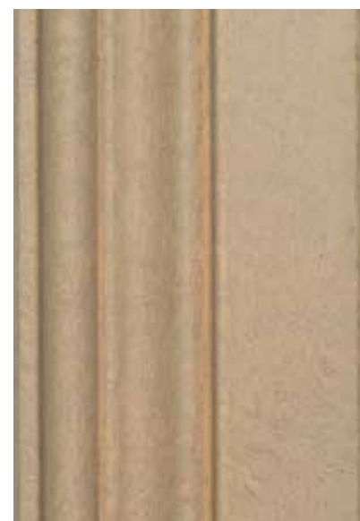
Laccati anticati/veneziani col. Argilla Antique lacquered finishing venetian finishing col. Argilla