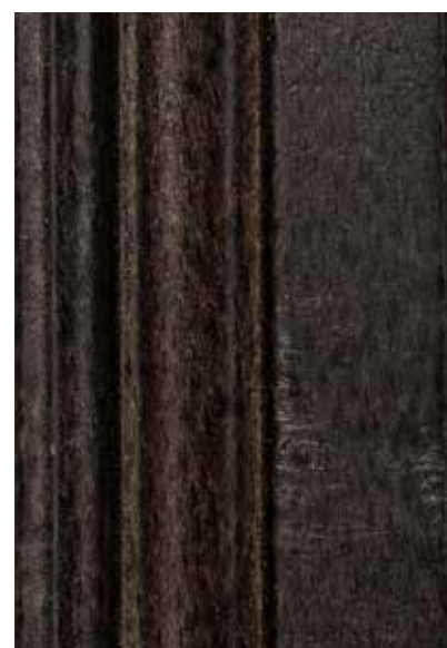
Laccati anticati/veneziani col. Ebano Antique lacquered finishing venetian finishing col. Ebano