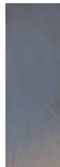
Acciaio satinato verniciato a liquido Satin steel painted with liquid