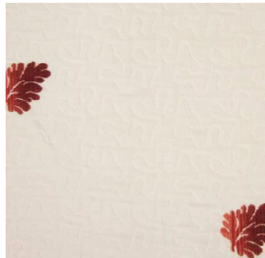
C 73615 10%CO 66%PL 24%PC 280 cm height L. 47,5 cm