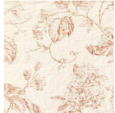
C 73635 10%CO 66%PL 24%PC 280 cm height L. 64 cm