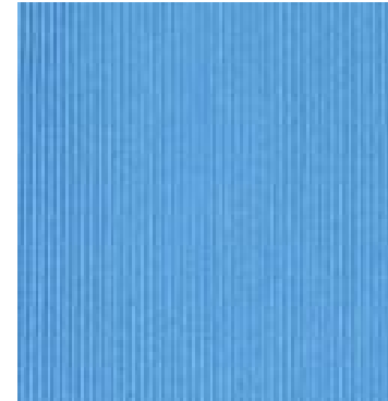
A 71240 53%PL 47%CO 280 cm height -