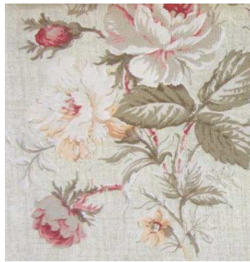
A 71602 100%CO 280 cm height L. 64 cm