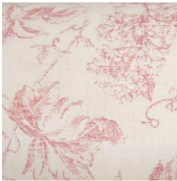
A 71605 100%CO 280 cm height L. 64 cm