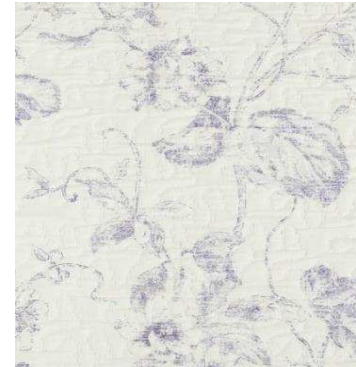
C 73633 10%CO 66%PL 24%PC 280 cm height L. 64 cm