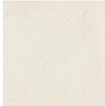
A 71200 59%CO 41%PL 280 cm length H. 17,2 x L. 21,5 cm