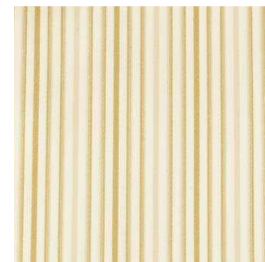
C 73622 28%CO 72%PL 280 cm height L. 6 cm