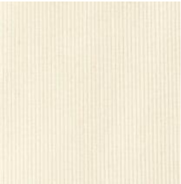
C 73300 100%CO 180 cm height -